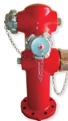
HIDRANTE DE COLUMNA HÚMEDA