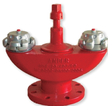
HIDRANTE DE ARQUETA