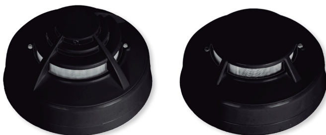
Otros colores, bajo petición